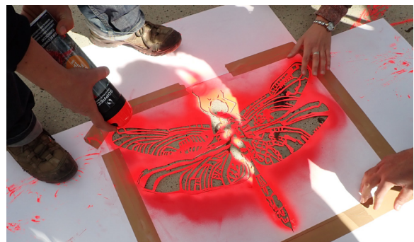
Étape 2 : chaque CBN mobilise les publics pour taguer la silhouette de la plante choisie sur son territoire, du lieu d'exposition vers un espace de plus en plus éloigné...