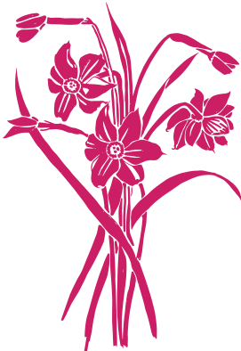
Narcisse des poètes Narcissus poeticus