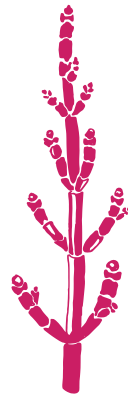
Salicorne d'Europe Salicornia europaea