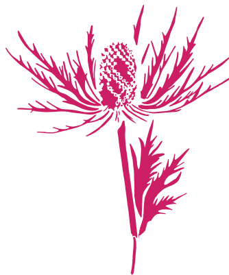
Le Chardon bleu Eryngium alpinum