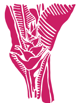
Le Balizyé Heliconia caribaea