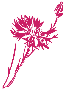
Bleuet des moissons Cyanus segetum