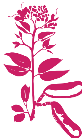
Courbaril Hymenaea courbaril