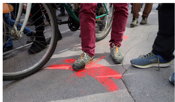
Étape 4 : le passage répété du public sur les silhouettes taguées au sol amplifera la portée du message envoyé par les CBN