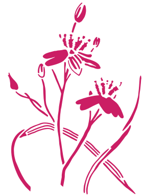
Siméthide à feuilles planes Simethis mattiazii