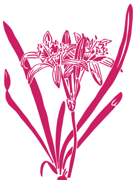
Lis des sables Pancratium maritimum