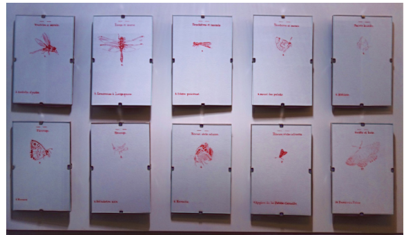
Étape 1 : poèmes et dessins exposés dans un ou plusieurs lieux choisis par chaque CBN

Cette performance s'appuie sur une expérience passée de l'artiste à propos d'insectes en voie de disparition. Pour cette oeuvre envisagée avec les CBN, les pochoirs représenteront des silhouettes végétales et seront graphés à l'aide d'une peinture écologique.