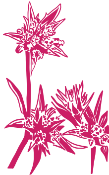
Panicaut vivipare Eryngium viviparum