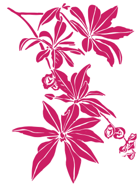
Benjoin Terminalia bentzoe