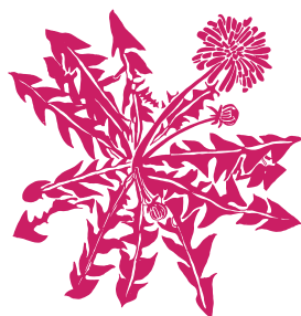
Pissenlit Taraxacum sp.