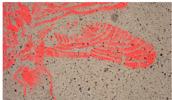
Étape 3 : les silhouettes interpelleront le public invité à se renseigner sur l'origine de ces dessins et leur signification (réseaux sociaux, web) tandis que des animations sont proposées pour approfondir les messages véhiculés par les CBN