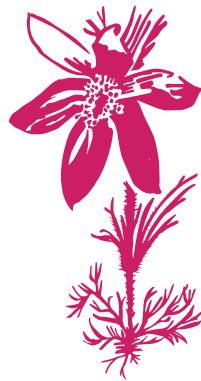
Anémone pulsatile Pulsatilla vulgaris